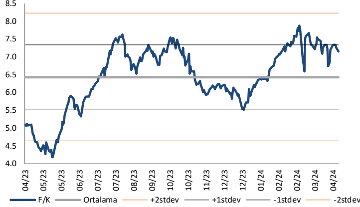
BIST 100 F/K (Cari)