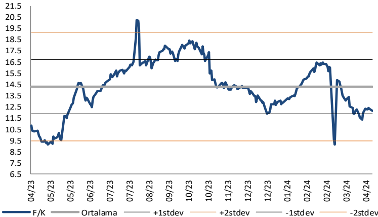
XUSIN F/K (Cari)